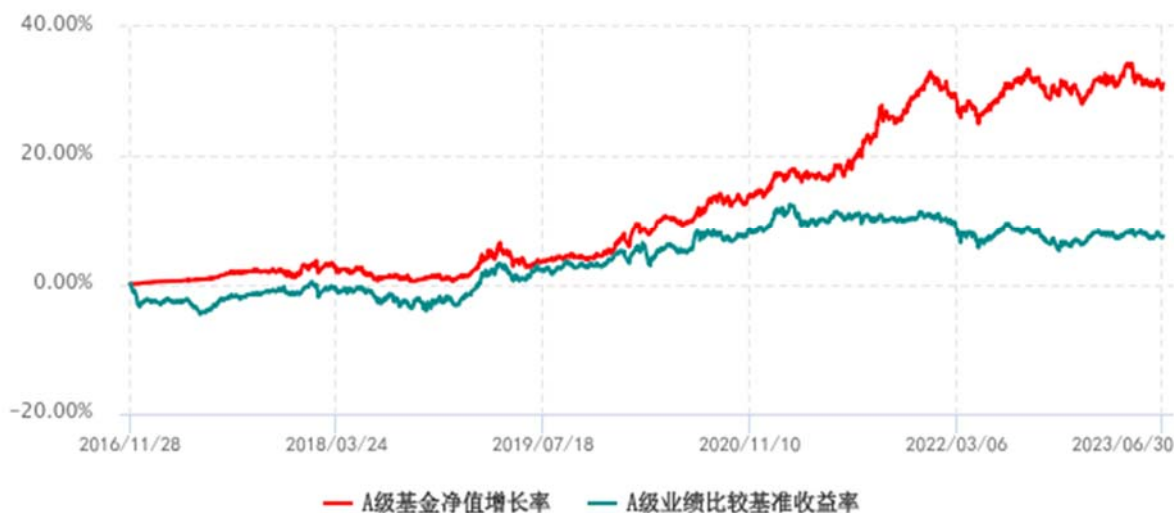
A 级基金份额累计净值增长率与同期业绩比较基准收益率历史走势对比图 (2016年11月28日-2023年06月30日)